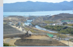
沿岸部では炭上げが始まっています