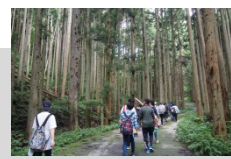
山のアクティビティ・行者の道を散策し自らと向き合いました (Act1)