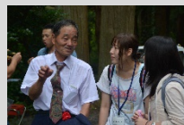
村祭りを見学と、地元のお年寄りへのインタビューを行いました(Act3)