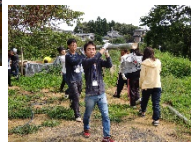
気仙沼あそびーばーで流しそめんを行いました(Act4)