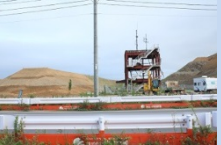
道路を挟んで臨む防災庁舎