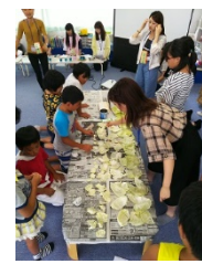
小学生のみんなとキャベツの葉っぱの枚数を数えました (Act1)