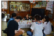
地域のお年寄りにインタビューを行いました(Act1)