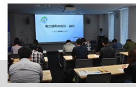
南三陸町役場の方の防災に関する講和 (Act3)