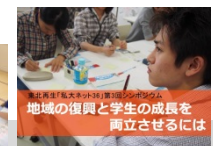
地域の復興と学生の成長を両立させるには