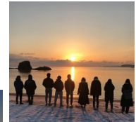
南三陸の日の出を眺む (Act1)