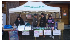
道の駅で南三陸の物産を販売しました (Act1)