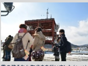
雪の残るなか町歩きを行いました(Act1)