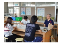
現地の方の体験を聞き、「いのちでんでんこ」について考えました(Act2)