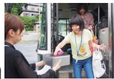
デジタルデスクで携帯電話がない4日間を過ごします (Act3)

Act ①「食」の楽しさでつながる旅 Act ②防災 ~あの日の震災を忘れない~ Act ③Reason (再生) ~セルフケア力を養う~