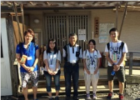
仮設住宅・公営住宅などでお話をうかがい、 コミュニティについて考えました(Act1)