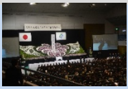
あの日から丸3年 追悼式典