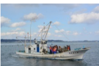
一次産業の体験を通して復興を考えました(Act1)