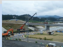
高台に囲まれた防災庁舎