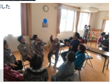
仮設・公営住宅で交流を深めました (Act2)