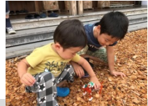
ロボットや紙飛行機などをこどもたちと 楽しみました(Act1)