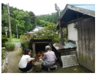
小さな集落を訪れ、その様子を映像にまともしました(Act2)