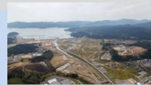
震災から4年経った南三陸町沿岸部の様子