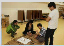
災害に備えるための“もの”づくりについて学びました (Act3)