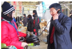
デレフォノスコープで人々の声を集め、南三陸の「今」について考えました (Act1)