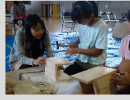
清水建設さんが志津川小学校で行った木工教室のお手伝いに行きました(Act2)