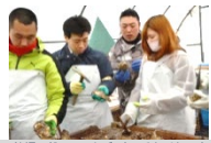
社員の殻についてゴミを取っ手伝いをしました(Act3)