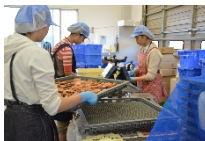
地元の商店のお手伝い。南三陸の産品をもっと東宮で流通させるにはどうしたら良いか考えました(Act4)