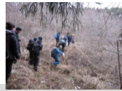
避難道としても使った旧道を歩きました(Act2)