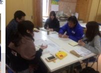
新たなさんさん商店街をイメージして 商品などの提案をしました(Act3)