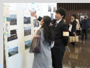
始まるシンポジウムで、ポスターセッションの説明をする学生