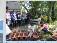
「橋の避難路」のため、橋を植栽しました(Act4)