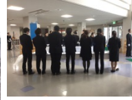
東日本大震災南三陸町追悼式(Act3)