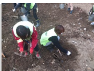
災害ボランティアセンターに登録し、がれき撤去作業(プレプログラム)