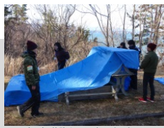
サバイバル体験やマインドフルネスを通して、自らの未来について考えました (Act2)