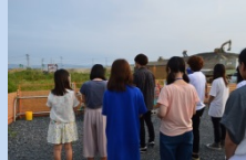
左奥に小さく見える防災庁舎