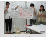
再生可能なエネルギーについて考えました(Act1)