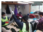
わかめ漁家さんのお手伝い(オープニングプログラム)