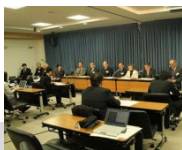
文部科学省で行われた設立記者会見の様子