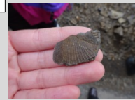
サイエンスをテーマにツアーを企画 しました(Act3)