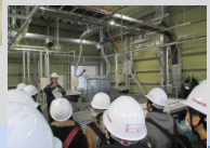
自然(森・海)と人の共存について 考えました(Act4)