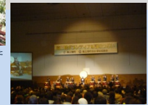
南三陸ボランティア感謝のついで