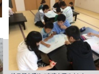
日記を通じて交流を深めました(Act3)