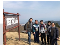
南三陸の魅力のひとつ田東山 (Act2)