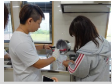
南三陸の海水を利用し、塩づくりを行いました (Act2)

Act ①Reason (再生) ~セルフケア力を養う~ Act ②南三陸ソルトツアー ~風土と人々に出会う塩の旅~ Act ③本当に必要な“もの”づくりを考える