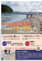
これから大学が地域と共にできることを考える