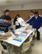
住民の方と一緒に物語を作り上げました(Act2)